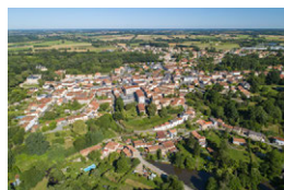
En couverture : vue aérienne de Mouchamps (85)

Des articles émanant d'autres disciplines (économie, sociologie, histoire, écologie...) portant sur la dimension territoriale des sociétés peuvent être proposés.