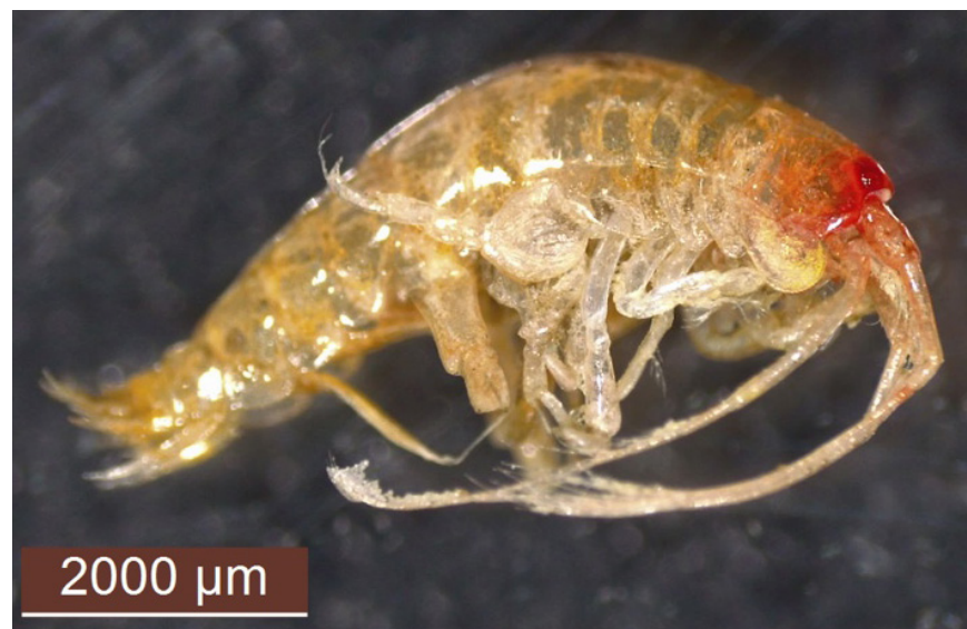
Photo 1 - Prise de vue d'un Haploops nirae