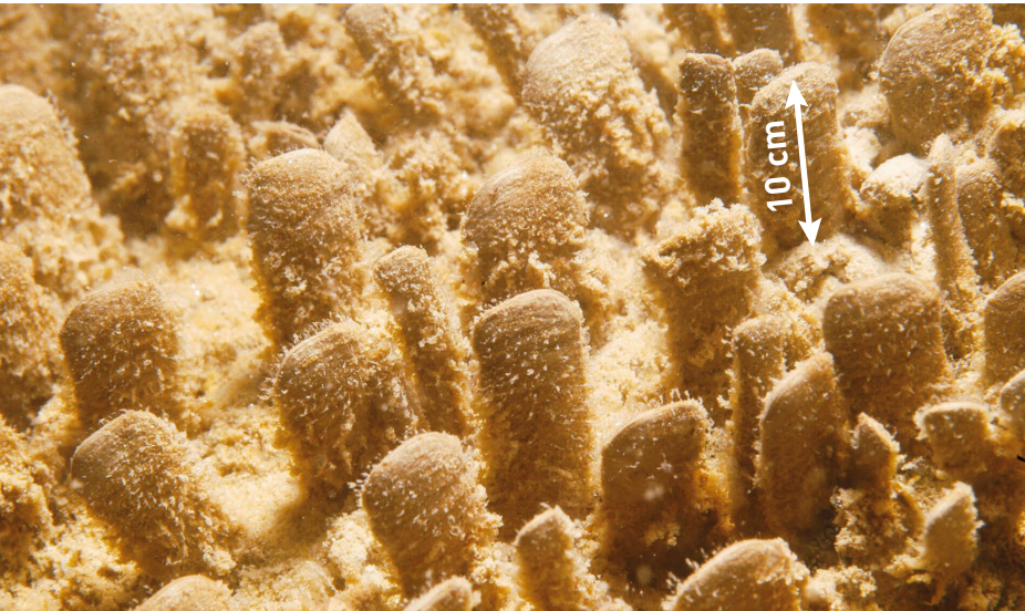
Photo 2 - Habitat en forme de tubes d' Haploopsis nirae